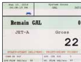
7 Campos Configurables