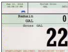
2 Campos Configurables

Cambiar rápidamente entre 4 pantallas de entrega configurables que muestran la información que necesita - incluso mientras se alimenta. Inventario adicional, la presentación de informes, configuración y otras pantallas votan la funcionalidad TCS 3000 al siguiente nivel. Entrega pantalla con 1 campo configurable se muestra a la derecha.