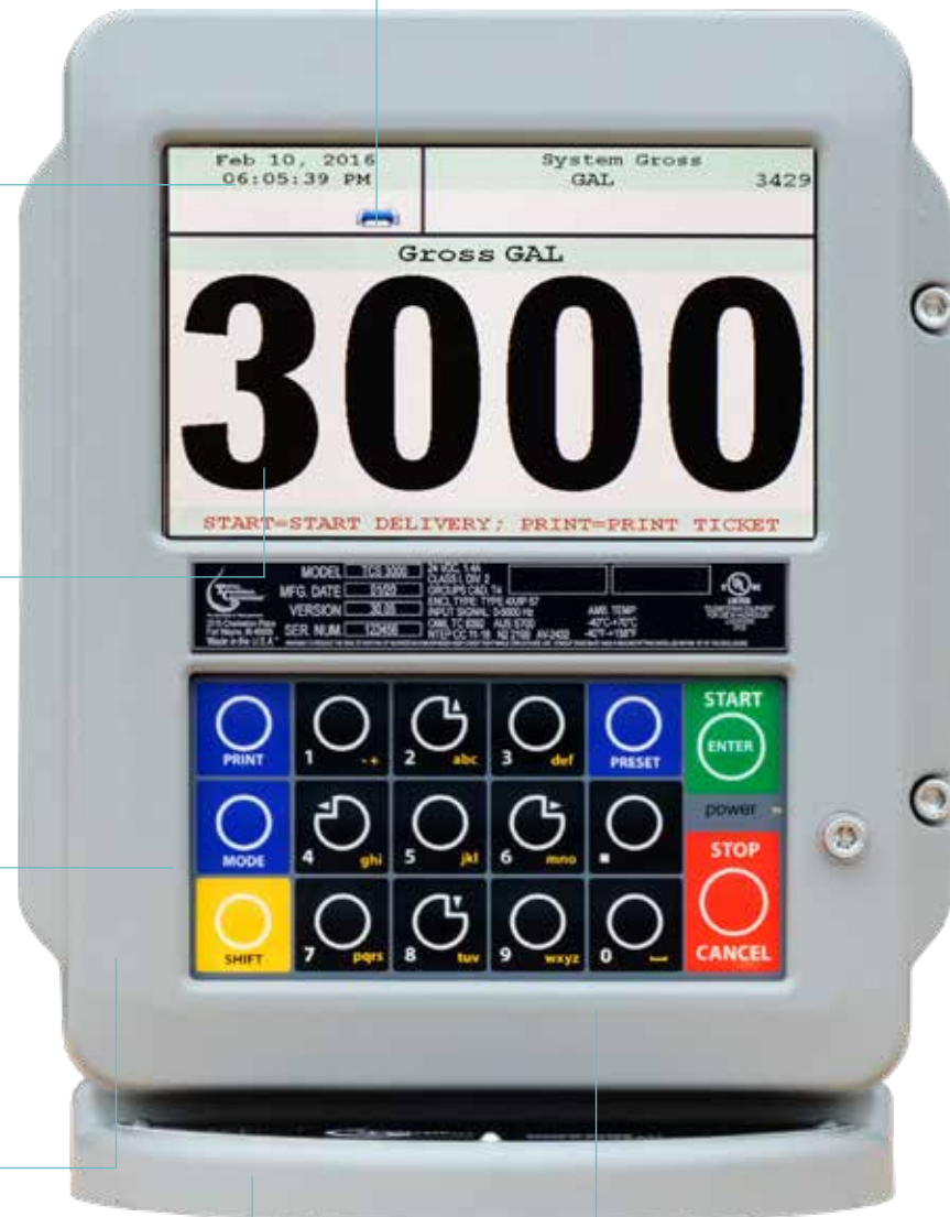
Mostrado: 1 Campo Configurable

Configuración de la TCS 3000 es fácil y se puede hacer sin otros dispositivos auxiliares. Se agiliza su instalación y significativamente reduce los costos. Después de la instalación, el TCS 3000 es tan fácil de mantener. Iconos en pantalla y mensajes de estado se muestra para un rápida solución. Arquitectura de programación abierta permite que el TCS 3000 para mantenerse al día con las nuevas características. Las actualizaciones pueden hacerse a través de una unidad flash USB.