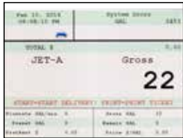
11 Campos Configurables